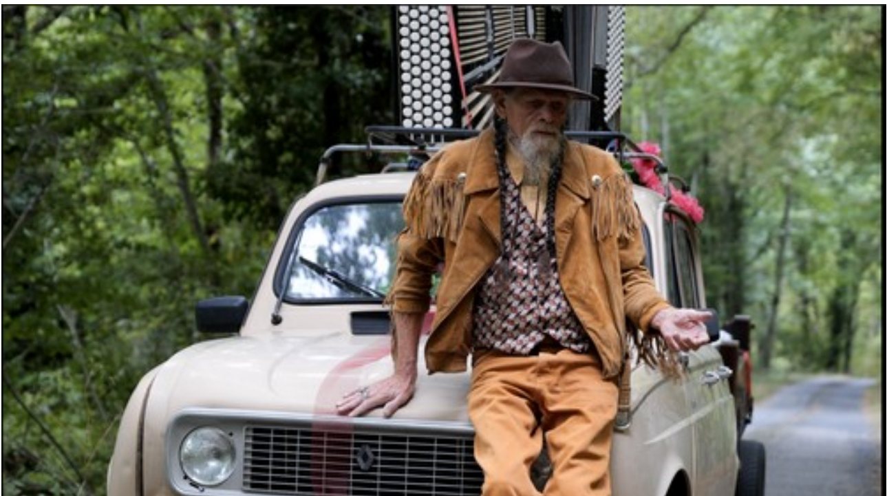
Extrait du film