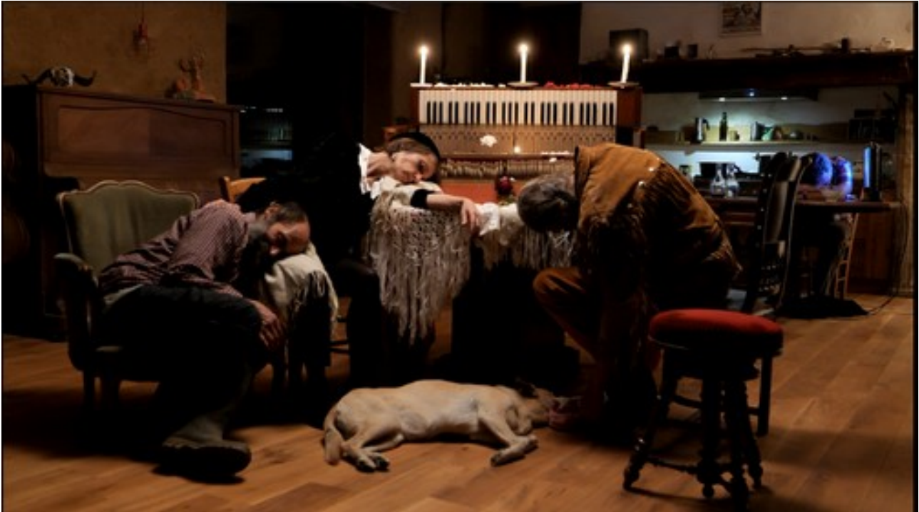
Extrait du film