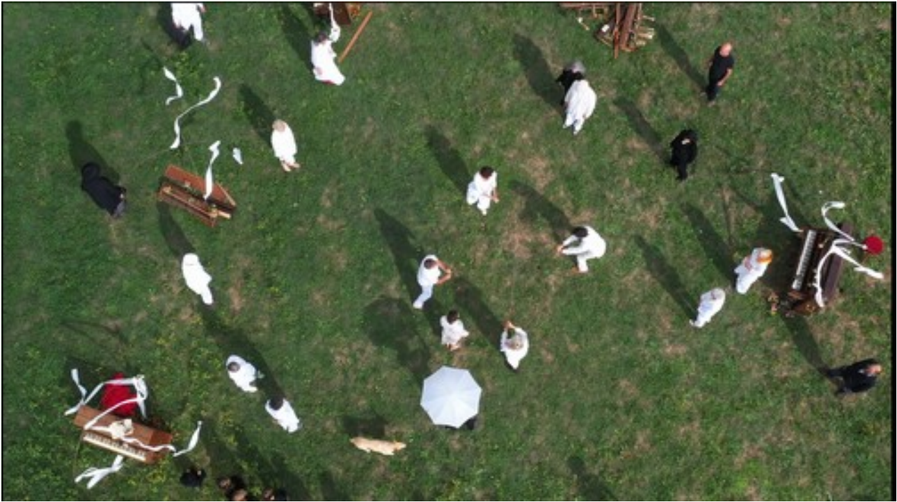
Extrait du film