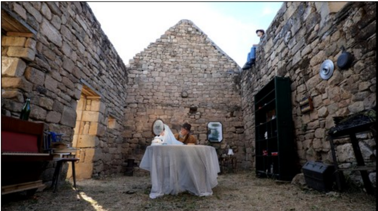
Extrait du film